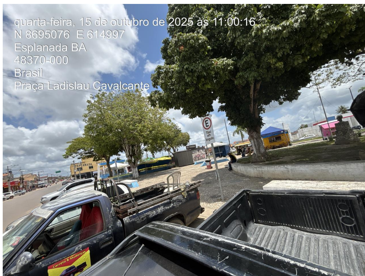
FOTO 07 - LOCAL DE 3 QUIOSQUES

ESTADO DA BAHIA PREFEITURA MUNICIPAL DE ESPLANADA CNPJ – 13.885.231/0001-71