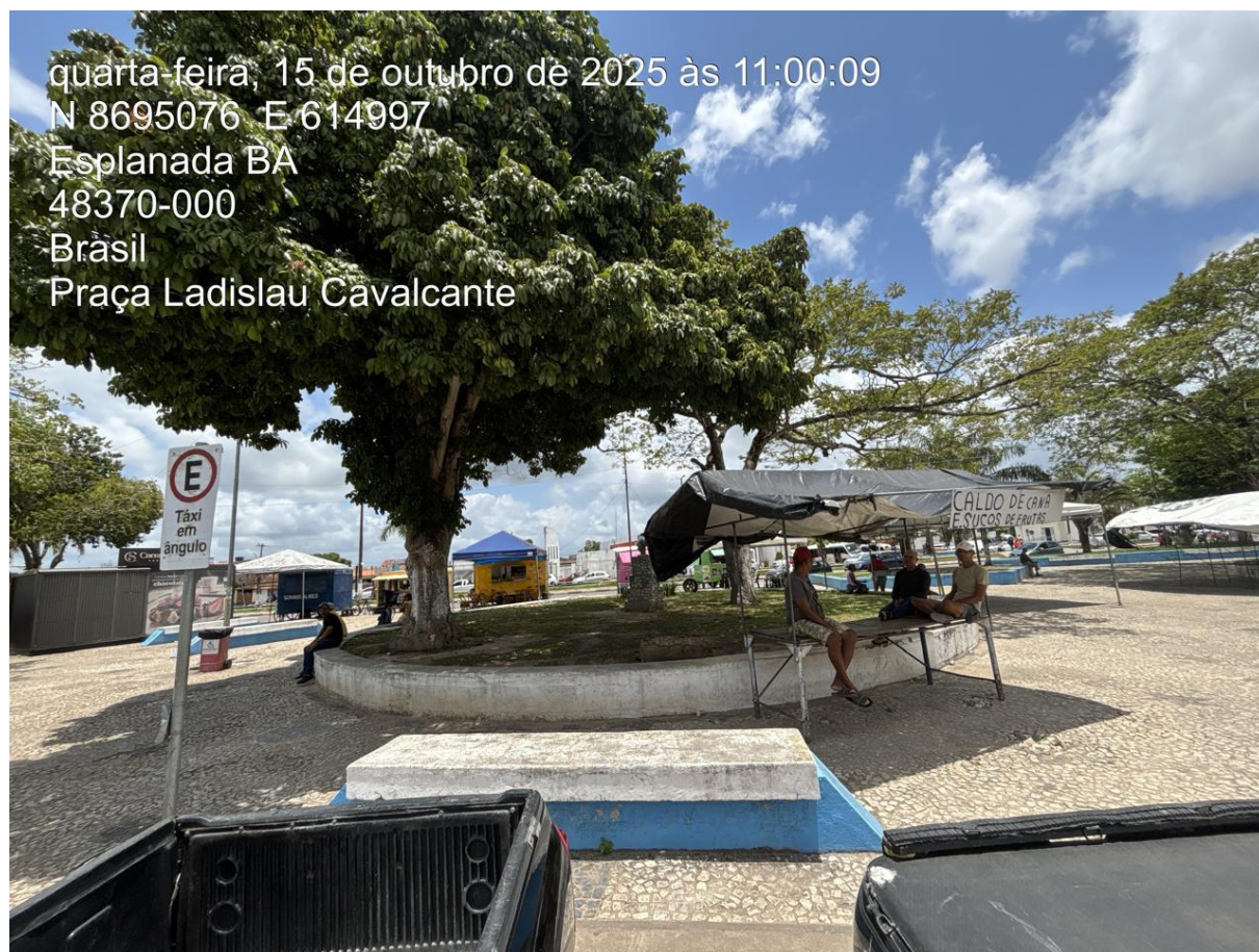
PONTO 06 – LOCAL DA FONTE INTERATIVA

ESTADO DA BAHIA PREFEITURA MUNICIPAL DE ESPLANADA CNPJ – 13.885.231/0001-71